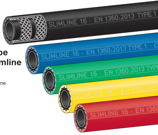
Type Slimline SL Slimline

Qualitäts-Zapfschläuche SLIMLINE für Otto- und Dieseldieselkraftstoffe. Auch für Ethanolbeimischungen bis E 85 und Biodiesel bis B30 (BIO-Type bis B100). Eichfähig für Zapfsäulen gemäß umseitiger Erläuterungen. Kältebiegsam bis -30°C (LT-Type bis -40°C), Temp. bis +55°C. Entsprechen der EN 1360 bzw. EN 13483. Innen : NBR schwarz, nahtlos extrudiert, elektrisch ableitfähig, nicht ausfärbend Festigkeitsträger : zwei dehnungsarme Textilgeflechte mit gekreuzten, eingeflochtenen Spezial-Leitfäden Außen : glatt, öl-, UV- und ozonbeständig, hoch abriebfest. Werkstoff siehe Tabelle.