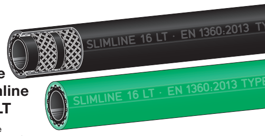
Type Slimline SL LT Slimline Low Temperature