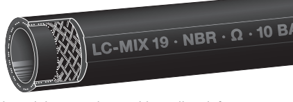
Type LC-Mix Lining NBR electr. dissipative

Preisgünstiger Leicht-Zapfschlauch mit Textilgeflecht für Otto- und Dieseldieselkraftstoffe, Heizöl, Petroleum. Nicht eichfähig.