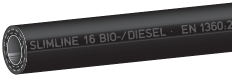
Type Slimline SL BIO Slimline Biodiesel

SLIMLINE quality petrol pump hoses for gasoline and diesel fuels. Also suitable for fuels with ethanol content up to E 85 and Biodiesel up to B30 (BIO Type up to B100). Meets weights and measures regulations, see overleaf. Cold flexible down to -30°C / -22°F (LT-type down to -40°C / -40°F), temp. up to +55°C / +131°F. Correspond to EN 1360, respectively EN 13483. Lining : Nitrile rubber (NBR), black, seamlessly extruded, electrically dissipative, no discoloration Reinforcements : Two low tensile textile braids with crossed, interwoven conductivity strands Cover : smooth, UV and ozone resistant, oil resistant, highly abrasion resistant. Material see chart.